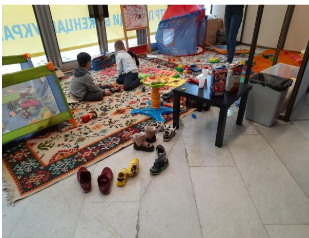
Изграденият детски кът