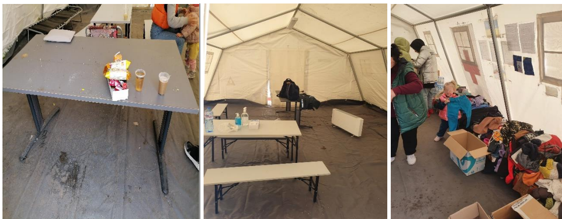
Условията в палатките за отдих

Със съдействието на Противопожарната служба на територията на ГКПП Дуранкулак е докарана водоноска с вода за хигиенни нужди. На нея са поставени предупредителни надписи, че водата не е питейна. Намиращите се на място контейнери за боклук бяха малко на брой, препълнени с различни отпадъци и се налагаше да бъде извършено спешно сметосъбиране и сметоизвозване.