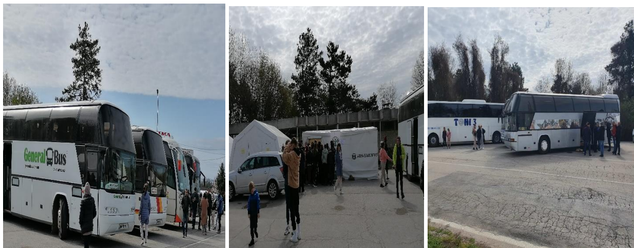
Част от автобусите на територията на ГКПП Дуранкулак

Беше констатирано и че има известно количество украински граждани, които преминават границата, без да се регистрират за получаване на временна закрила, както и граждани на други страни, което води до натоварване на работния процес на ГКПП Дуранкулак и преумора на персонала.