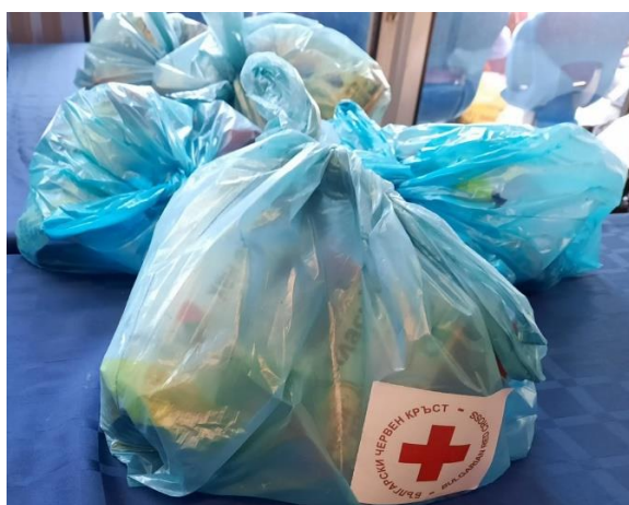
Пакетите с храна и напитки на БЧК