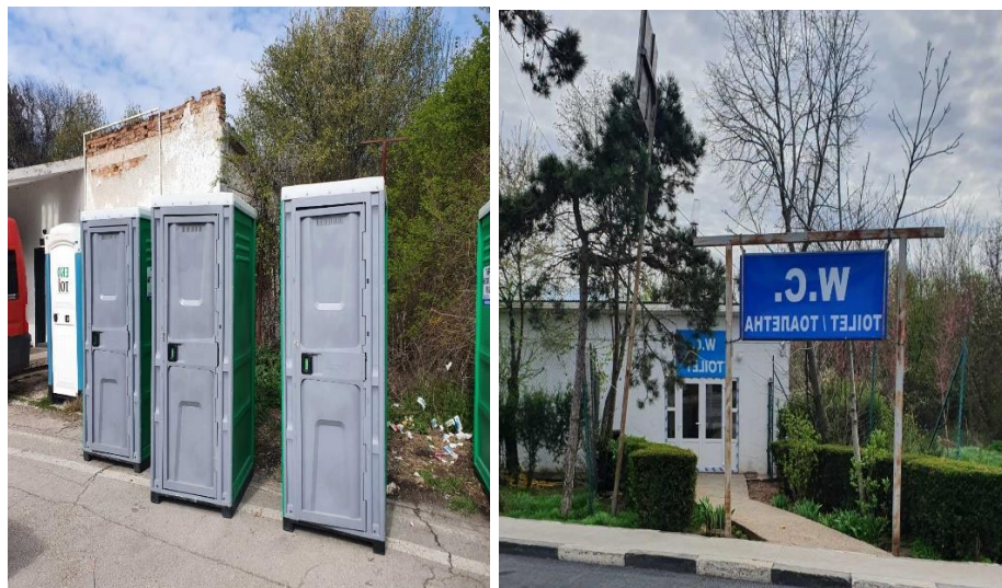
Местата за ползване на тоалетна

С оглед непредвидимия поток от украински граждани и струпването на множество автобуси в граничната зона са разположени около десет броя еко-тоалетни. На място са разпнати палатки, оборудвани с маси, пейки и походни легла. Екипът на НПС установи, че не са достатъчни пейките и походните легла в палатките поради големият брой пристигащи украински граждани, много от които са малолетни деца.