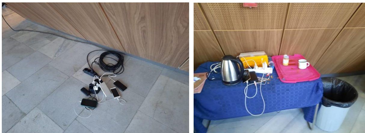
Предоставено е електричество за зареждане на мобилни телефони