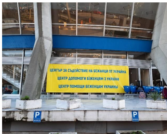
Дворец на културата и спорта, гр. Варна