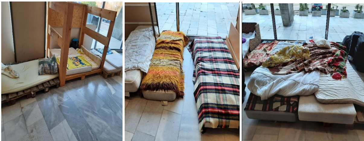
Месата за сън на приземния етаж в залата

Екипът на НПМ констатира, че на мястото е изграден детски кът и са поставени матраци със завивки за пристигащите малолетни деца. Предоставено е и електричество за зареждане на мобилни телефони. При разговор с украински граждани се установи, че всички пристигат от места с активни военни действия. Представителите на БЧК раздаваха найлонови торбички с кроасани, вафли, солети и натурални сокове. Към момента на извършване на проверката, екипът на НПМ срещна украински граждани, с които беше проведен разговор по-рано през деня на ГКПП Дуранкулак. Същите заявиха, че им е предоставена временна закрила и очакват да бъдат насочени към мястото, където ще отседнат.